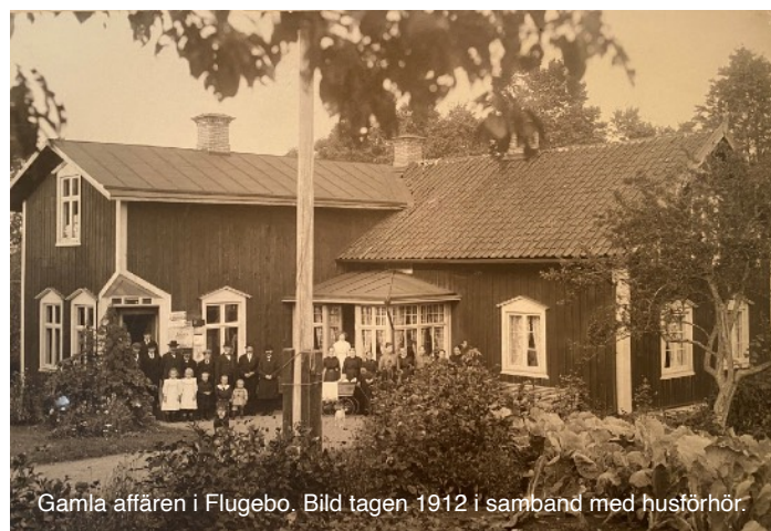
Gamla affären i Flugebo. Bild tagen 1912 i samband med husförhör.

Längst ner mot sjön ligger den f.d. affären i Flugebo. Där träffar vi Gunn Washholm som sedan många år är bosatt en bit söder om San Fransisco i USA. I stort sett varje år tillbringar hon ett par sommarmånader i Flugebo.