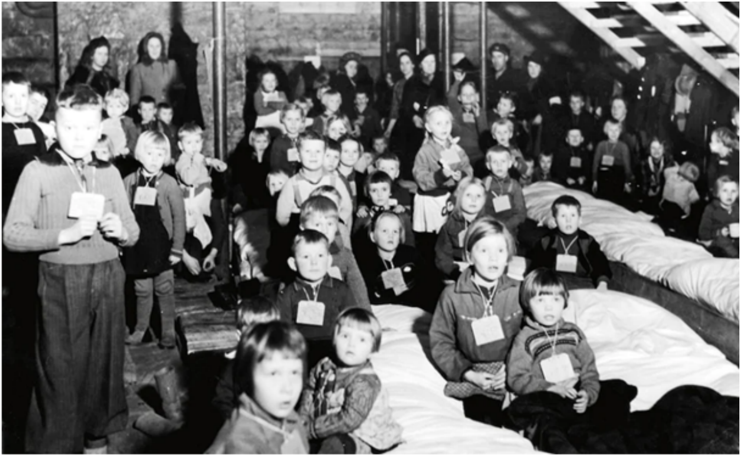
Finska barn som åker med ångfartyget Arcturus från Åbo till Stockholm.

Det är snart 80 år sedan 2: a världskriget slutade och idag finns inte så många som har tydliga minnen av krigsåren men Trehörnabladet har träffat några gamla Trehörnabor och här är deras minnen.