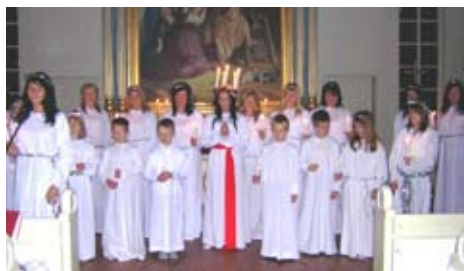
2006 års luciafirande