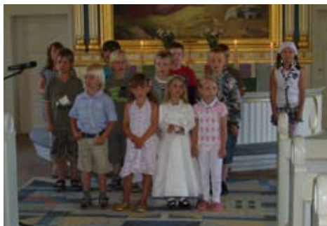
Skolans elever i kyrkan