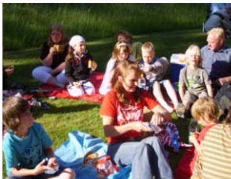
Avskedsfika utanför Hembygdsgården