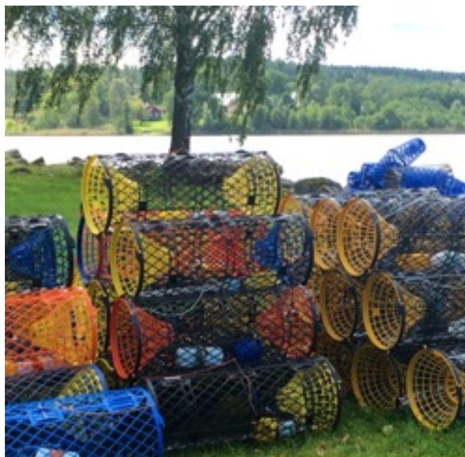
Det går åt många burar för att fånga mycket kräftor i sitt område